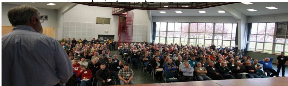
[Journées d'Étude à Marsannay-La-Côte]