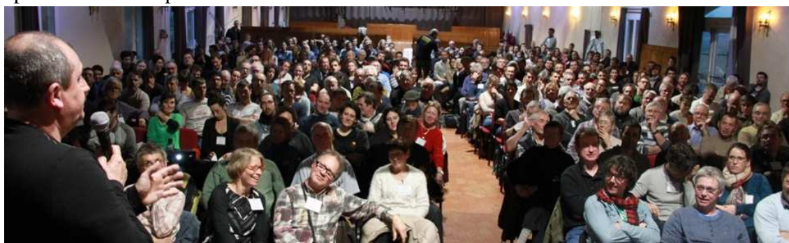
[Journées d'Étude à Lattes]